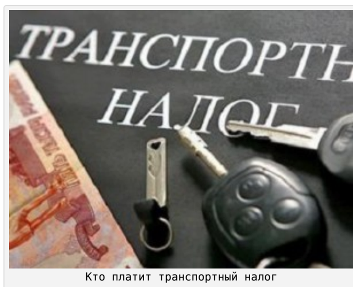
Кто платит транспортный налог

В соответствии со статьей 357 Налогового кодекса Российской Федерации установлено, что плательщиками транспортного налога признаются лица, на которых в соответствии с законодательством Российской Федерации зарегистрированы транспортные средства, признаваемые объектом налогообложения в соответствии со статьей 358 Кодекса.